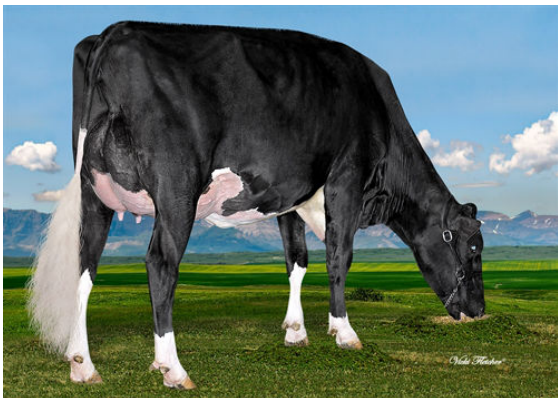
WESTCOAST MONTANA RIZA 4700 GRANDDAM