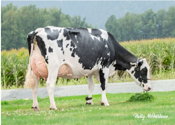
WESTCOAST ALCOVE RIZA 7512 DAM